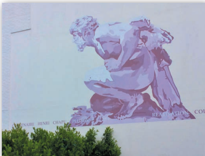
(Fresque murale d'après un dessin d'Henri Chapu, avenue de la Gare)

Remonter de l'autre côté de celle-ci et traverser au premier passage protégé ; poursuivre la montée jusqu'à la première rue (rue Chapu) que l'on suit, à droite, sur un étroit trottoir jusqu'au musée Chapu. A droite juste après celui-ci, entrer dans le parc (petit escalier). Suivre le sentier dans le bois ; au croisement : à gauche, et un peu plus loin le sentier longe un très vieux sophora du Japon ; au débouché dans le parc (aire de jeux) rester à droite pour redescendre, au premier croisement, par une allée qui longe plusieurs beaux arbres. Après le mur d'enceinte, continuer la descente jusqu'à arriver sur le quai des Tilleuls. Traverser pour retrouver le parking.