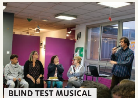
BLIND TEST MUSICAL