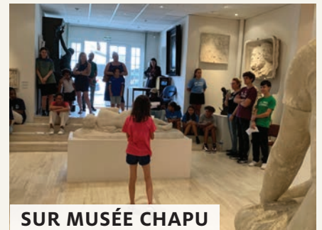
SUR MUSÉE CHAPU