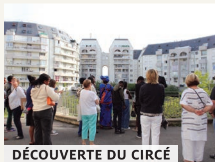
DÉCOUVERTE DU CIRCÉ