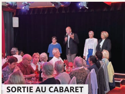
SORTIE AU CABARET