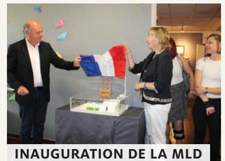
INAUGURATION DE LA MLD