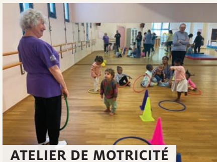
ATELIER DE MOTRICITÉ

Événement incontournable au Mée, la Semaine bleue a été de nouveau l'occasion pour les retraités de la Ville de partager de nombreux bons moments . La semaine a commencé par la marche bleue qui a rassemblé de nombreux Méens avant de se poursuivre avec les animations intergénérationnelles dont la découverte de la ferme pédagogique, un atelier motricité et un blind test musical mémorable ! La sortie au Cabaret de Samois-sur-Seine a fini de ravir les participants. ●